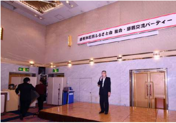
来賓紹介 由利本荘市市長 湊 貴信 様