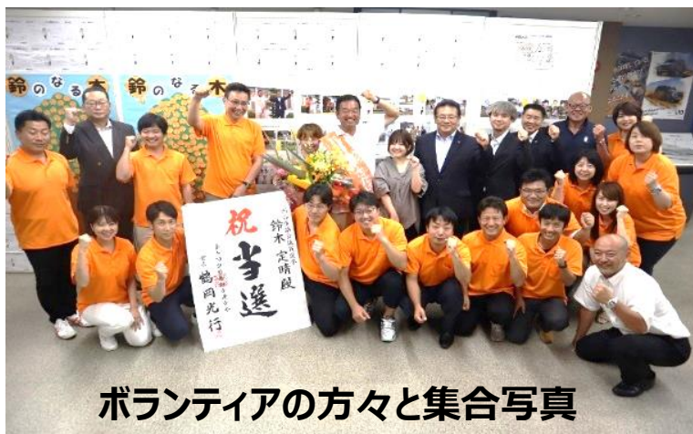
ボランティアの方々と集合写真