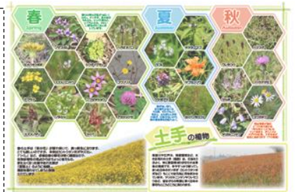
◎手作り観光ガイドブック

◆所感：組織内に市長直轄のPR専門部署をおき、さらに職員の方々自らが取材し手作りのパンフレットを作成していること、加えて、市職員が部署間を超えて市の良さを情報を共有しながらPRを推進していること、そのことを職員だけではなく、市民の方も市内外にPRするというように市全体で取り組みに対して意気込みを感じた。