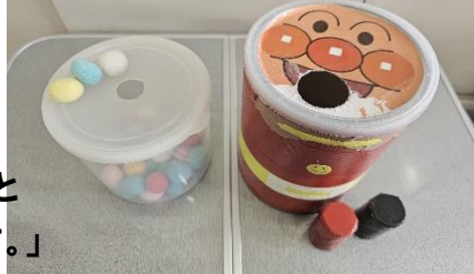
A ポンポン落とし B アンパンマン