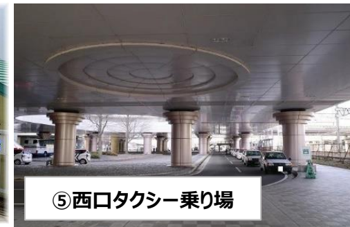
⑤西口タクシー乗り場