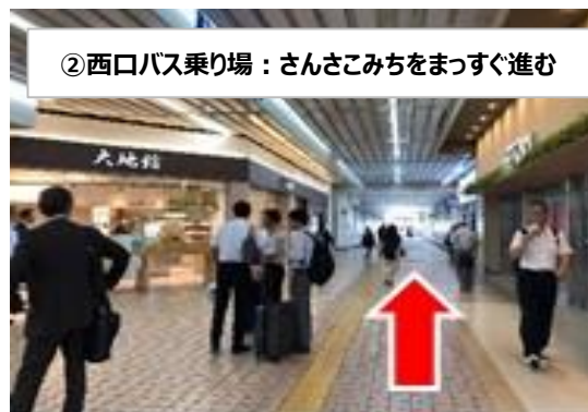
②西口バス乗り場：さんさこみちをまっすぐ進む

③東口バス乗り場には『LUSH』横のエスカレーターを利用して1Fに降りてください。