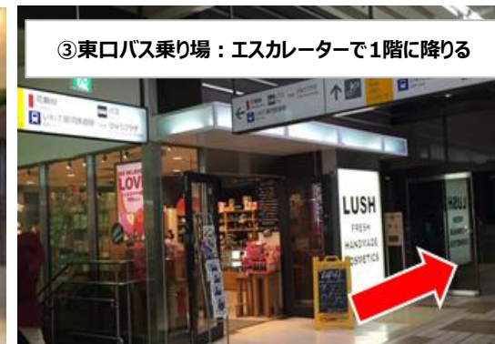
③東口バス乗り場：エスカレーターで1階に降りる