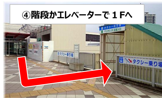
④階段かエレベーターで1Fへ