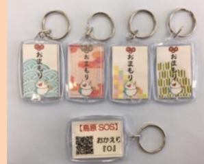
キーホルダータイプ