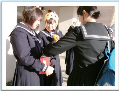
弥彦中学校の皆さん