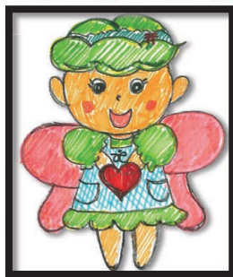
イラスト コーナー