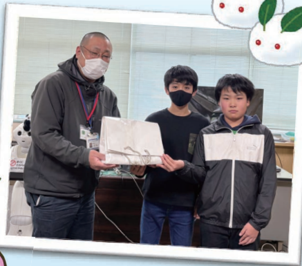
弥彦小学校の皆さん