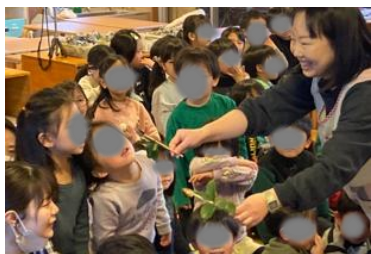
ヒライギワシの香り！

おにはそとー、ふくはうちー、ぱらぱら ぱら ぱら まめのおと♪今年の節分会は2月2日に行いました。全クラスで先月から絵本を読んだり「まめまき」のうたを歌いながら、まめまきを楽しみにする姿もあったことで、当日ホールは100人の大合唱となりました！「せつぶんだ まめまきだ」の紙芝居では、鬼は病気やけがや災害など私たちを苦しめる悪いものを表していることが伝わったと思います。またひいらぎに焼いたイワシの頭を差した「焼嗅(やいかかし)」の匂いをみんなで嗅いでもらいました。「くさ〜い」「お魚のにおい！」と様々な反応。鬼がいやがって逃げていくことも伝わったかな？みんな、健やかで毎日過ごせますように！