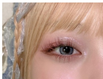
【1】正面右目アップ(開)