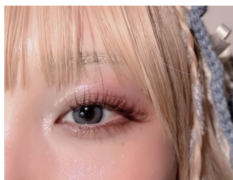
【2】正面左目アップ(開)