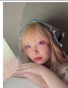
【3】ポージング (胸から上/まつ毛が分かるアングル)