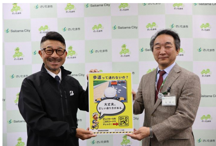
自転車を活用したまちづくりを推進する全国市区町村長の会 事務局長への寄贈

ブリヂストンサイクルは、企業コミットメント「Bridgestone E8 Commitment」※2で掲げる「Ease より安心で心地よいモビリティライフを支えること」「Empowerment すべての人が自分らしい毎日を歩める社会づくり」にコミットしていきます。