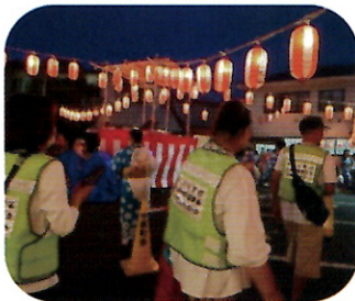
中原八幡神社盆踊り

「安心安全な立石地区のために」立石地区委員会環境部を中心に「第74回社会を明るくする運動」(令和6年7月21日(日))と「夏季パトロール」を実施しました。