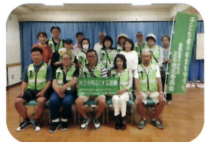
社会を明るくする運動 参加者18名

「安心安全な立石地区のために」立石地区委員会環境部を中心に「第74回社会を明るくする運動」(令和6年7月21日(日))と「夏季パトロール」を実施しました。