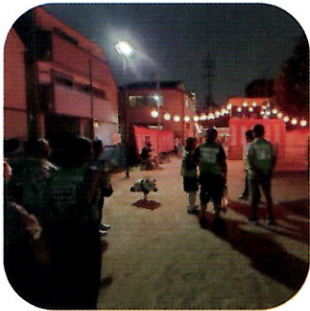
青戸南町会盆踊り