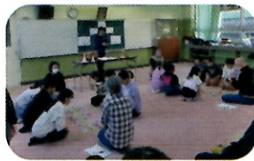
全区大会をめざして

立石地区3校から18名の児童が参加し白熱した競技大会となりました。結果は、3年生の部は清和小学校、4年生以上の部は葛飾小学校が1位になりました。 1位になった2チームは全区大会(令和7年2月15日(土))テクノプラザかつしかにて開催に挑みます。(取材:深山)