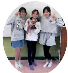
4年生以上の部 葛飾小チーム

立石地区3校から18名の児童が参加し白熱した競技大会となりました。結果は、3年生の部は清和小学校、4年生以上の部は葛飾小学校が1位になりました。 1位になった2チームは全区大会(令和7年2月15日(土))テクノプラザかつしかにて開催に挑みます。(取材:深山)