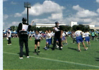
長縄8の字跳び 清和小チーム