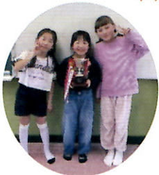
3年生の部 清和小チーム