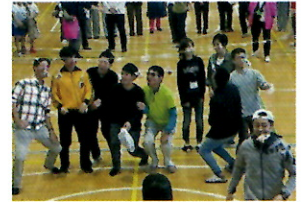
大人もパン食い競争