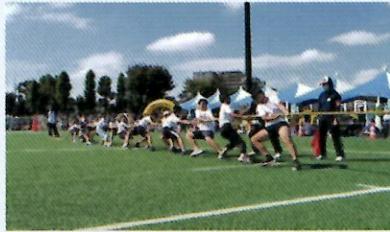
つなひき 梅田小チーム