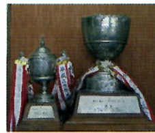
優勝トロフィー (左:男子1位 右:総合優勝)

令和6年10月8日(火)に葛飾区総合スポーツセンター陸上競技場で「第71回葛飾区中学校陸上競技大会」が行われ、立石中学校が総合優勝(男子1位 女子2位)を果たしました。雨が降り続くあいにくの天候でしたが、練習の成果をしっかりと出せました。