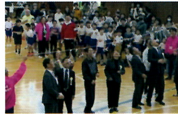
来賓の方々もパン食い競争に参加!