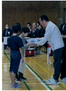
長縄8の字跳び1位 あじさい三日月子ども会Aチーム