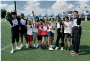
親子リレー 葛飾小チーム