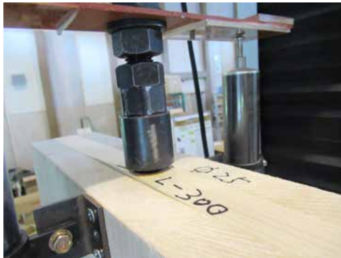
写真 1 接合具周辺木部の破壊