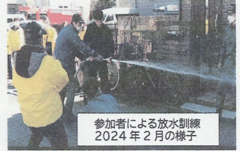
参加者による放水訓練 2024年2月の様子

近隣企業の方々、住民皆様のご参加をお願い申し上げます。小学生、中学生の参加も大歓迎。粗品進呈！