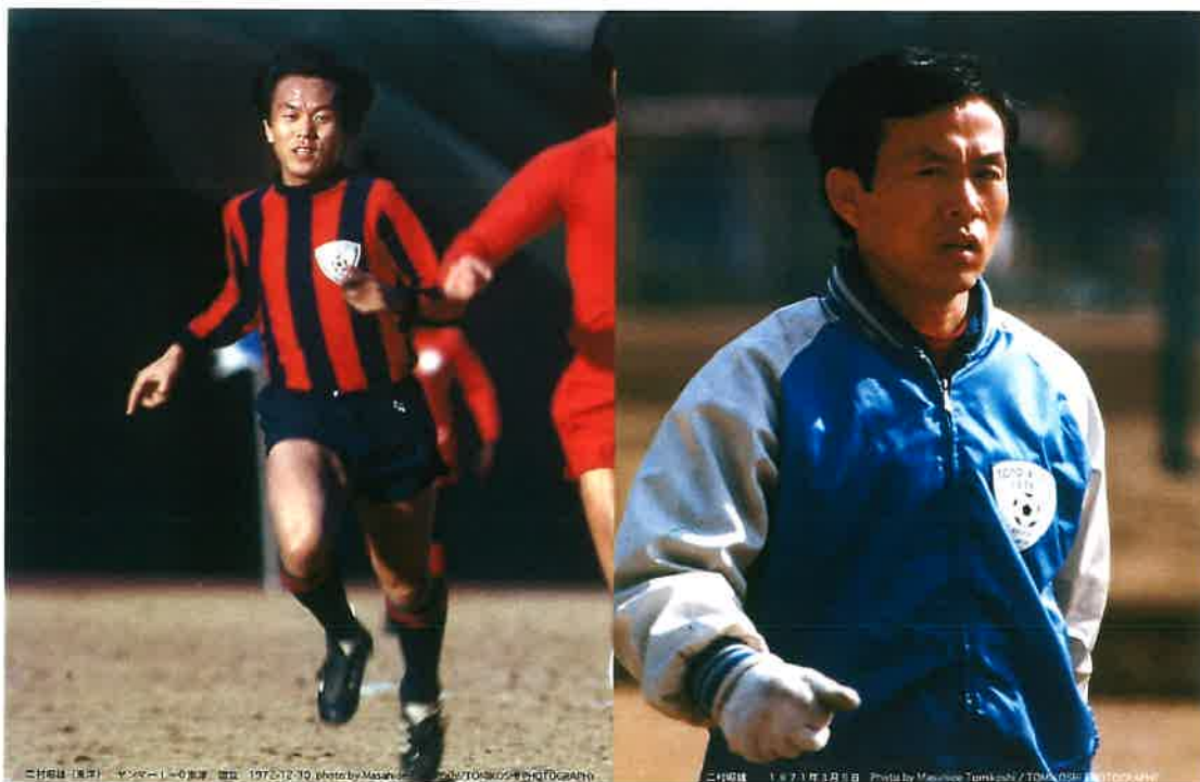
*1972年 東洋工業 VS ヤンマー戦にて (現：サンフレッチェ広島 VS セレッソ大阪戦)