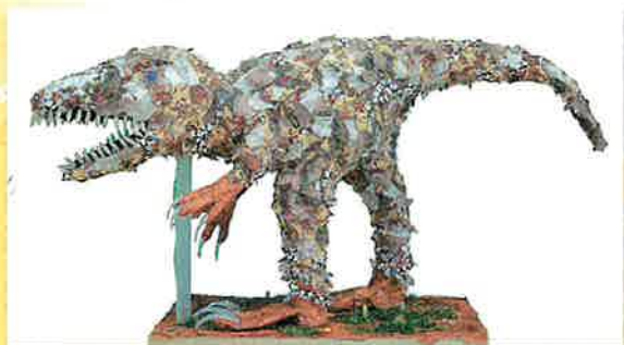
きょうりゅう、おおきいな 杉原 和成(福井県)