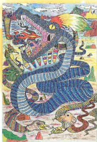
あれ?みんなへびに なっちゃった! 斎藤 諒(山形県)