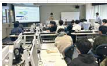
ゼミ生の研究発表の様子