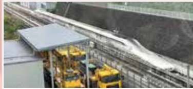
本物のリニアも見えました