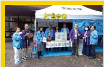
支部活動紹介コーナー