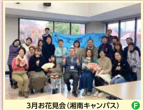
3月お花見会(湘南キャンパス)