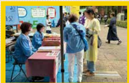
ぶんどら販売の様子

好天に恵まれた2日間、支部恒例のどら焼き“ぶんどら”販売の出店を行いました。今年も両日ともお昼過ぎには完売しました。併せて支部活動の紹介を行いました。