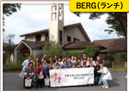
レストランの建物の前で