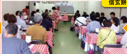
講習を受けていざ包装