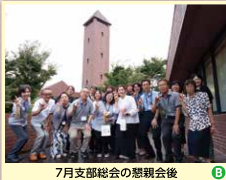
7月支部総会の懇親会后