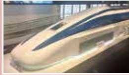
リニア模型を横から