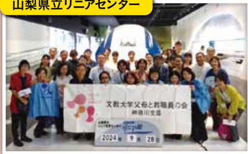
リニア模型の前で