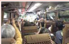
バス内のじゃんけん大会で大盛り上がり