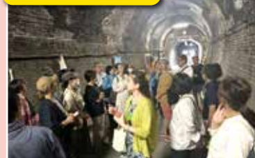
トンネルを利用したワイン貯蔵庫