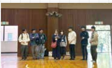
ドローン体験を体育館で