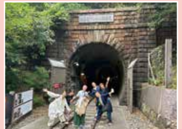
中央本線の旧線跡が遊歩道に