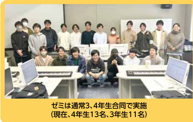
ゼミは通常3、4年生合同で実施 (現在、4年生13名、3年生11名)