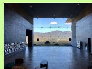
いわき市 草野心平文学館

★参加費 正会員 4000 円 賛助会員 4500 円 その他 5000 円 子どもは半額 (昼食代 1100 円は別途徴収)