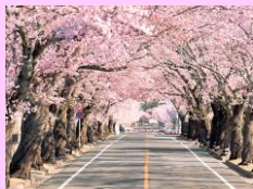
富岡町 夜の森桜並木

★参加費 正会員 4500 円 賛助会員 5000 円 その他 6000 円 子どもは大人の半額