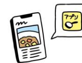
レシピサイトやアプリの利用