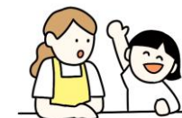
家族のコミュニケーションが増える