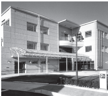
< 扶桑町総合福祉センター 外観 >