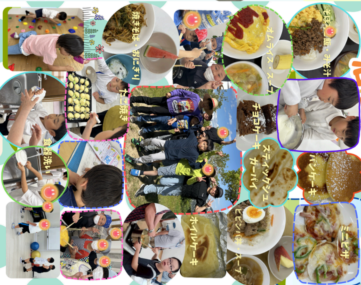
おぼろぎ飯・みそ汁