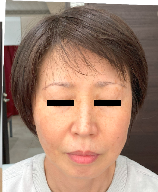
令和6年8月22日(木)施術前