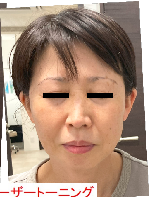
令和6年9月27日(金)施術前