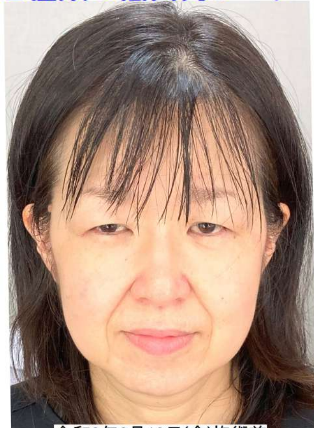
令和8年6月19日(金)施術前

2種類の低出力レーザー組合せメニュー、目元変化も重なり、若返り・美人度アップも達成