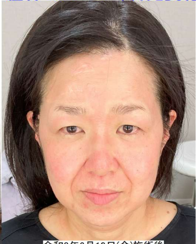
令和8年6月19日(金)施術後