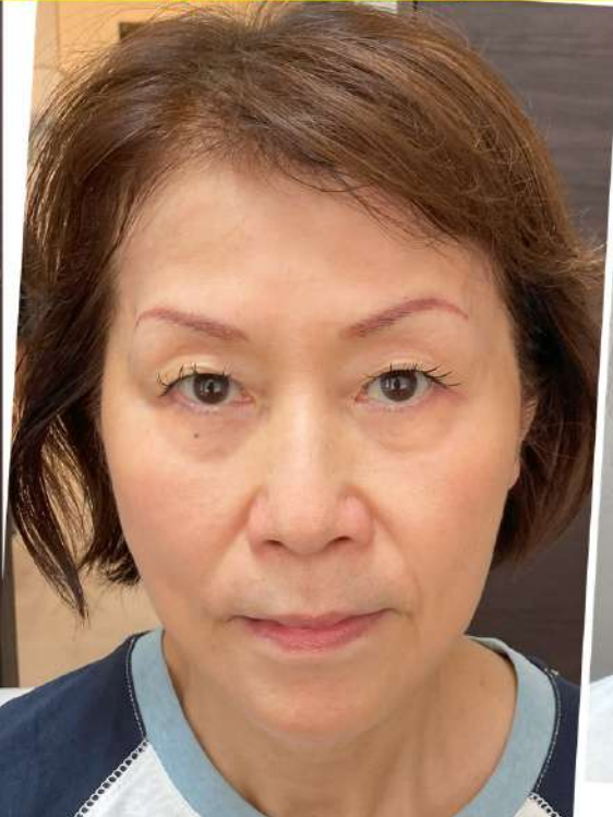
令和7年7月31日(木)施術前