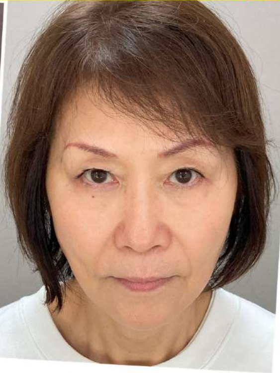
令和7年12月24日(水)施術前