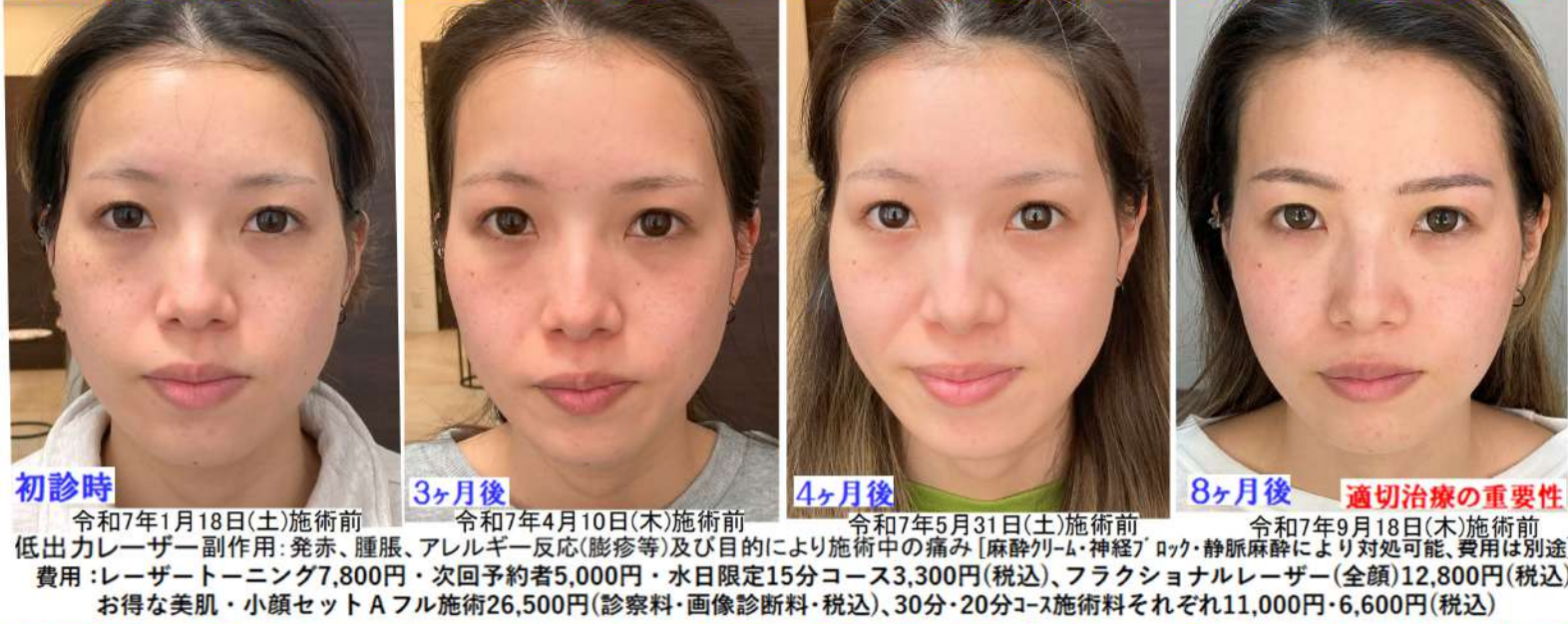
初診時 令和7年1月18日(土)施術前 3ヶ月後 令和7年4月10日(木)施術前 4ヶ月後 令和7年5月31日(土)施術前 8ヶ月後 令和7年9月18日(木)施術前 適切治療の重要性 低出力レーザー副作用: 発赤、腫脹、アレルギー反応(膨疹等)及び目的により施術中の痛み [麻酔クリーム・神経ブロック・静脈麻酔により対処可能、費用は別途] 費用: レーザートーンニング7,800円・次回予約者5,000円・水日限定15分コース3,300円(税込)、フラクショナルレーザー(全顔)12,800円(税込) お得な美肌・小顔セットAフル施術26,500円(診察料・画像診断料・税込)、30分・20分コース施術料それぞれ11,000円・6,600円(税込)

アレルギー性皮膚炎によるお顔の腫れに対して抗アレルギー剤を処方し、当院自慢のお得な美肌・小顔セットAを5回とレーザートーンニング単独を5回受けていただきました。