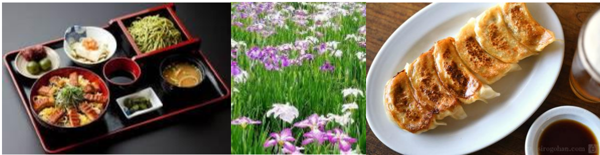
昼食《とらや柴又屋セット 1,800円》

池袋駅 8:25 発 ——— 日暮里駅 +++ (京成) +++ 江戸川駅 …… 小岩菖蒲園 …… 寅さん 記念館 …… とらや (昼食) …… 帝釈天拝観 …… 矢切の渡し …… 参道 …… (解散) ——— 亀戸餃子 ※ 帰りの時間は決めていません。いつでも・どこでも離脱OK