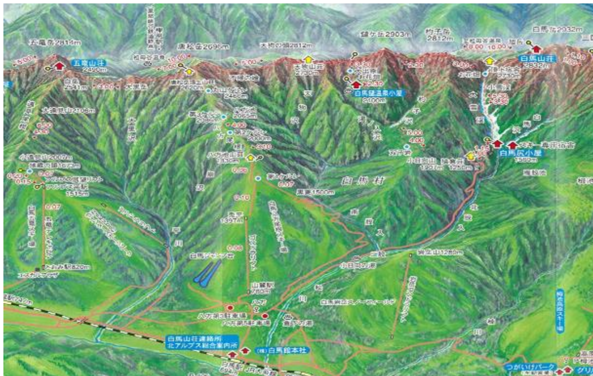
【白馬八方池：唐松岳に向かう途中】

■ 2日目朝、天気が良ければ八方ゴンドラ駅まで45分歩いてみましょう。 八方アルペンライン・ゴンドラとリフトを乗り継ぎ村営八方池山荘へ。休憩後八方池まで上がります。下山後、温泉に入り長野駅へ。