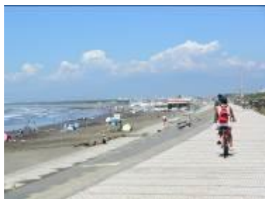
湘南海岸公園を歩く