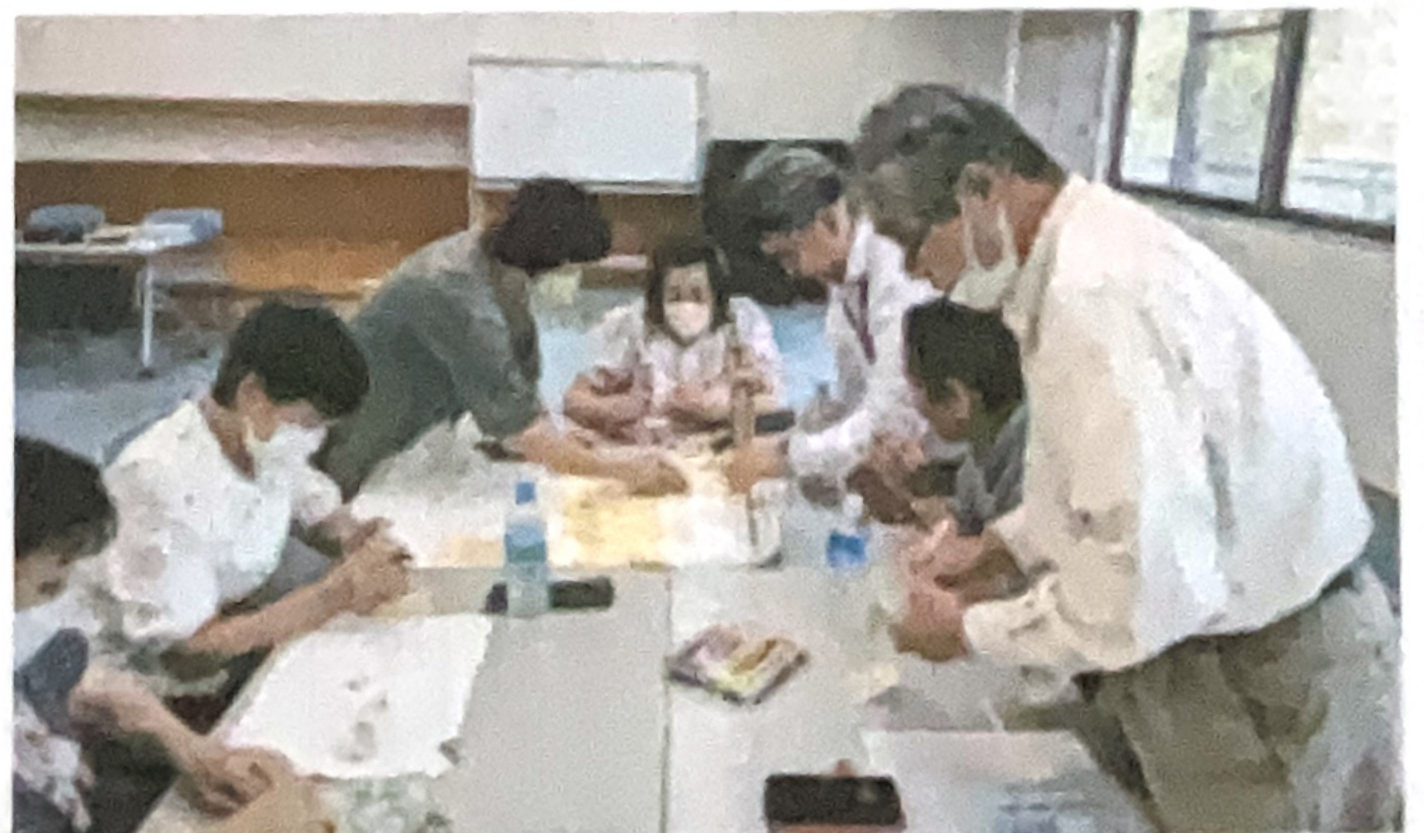
奥村さんのブレインストーミング風景