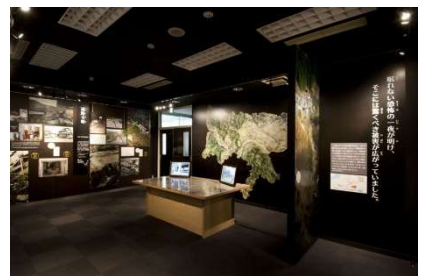
おぢや震災ミュージアムそなえ館