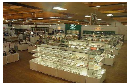
三条地場産業センター