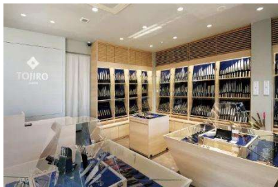
藤次郎ナイフギャラリー

本視察は「刃物と金属の聖地」と称される燕三条地域において、伝統技術の継承と現代産業への進化、そして未来への展望を体系的に考察することを目的としています。 まず、藤次郎ナイフギャラリーの視察では、伝統的な手打ちの技法と最新の工業技術を融合させた、現代のものづくりの最前線（現在）を体感します。製造工程を可視化した「オープンファクトリー」の現場からは、職人の高度な研磨技術や徹底した品質管理、さらには世界市場を席卷するブランド戦略の要諦を学びます。 次に、燕市産業史料館において、江戸初期の和釘づくりから始まった地域産業のルーツ（過去）を辿ります。国指定伝統的工芸品「鉋起銅器」などの精緻な職人技が、いかにして近代のカトラリー産業へと結びついたのか、その歴史の変遷を膨大な実物資料を通じて体系的に理解します。 締めくくりとして、三条地場産業振興センターにて、地域全体の製品群を俯瞰します。多種多様な利器工匠具や家庭用品が一堂に会するこの拠点は、産地全体が形成する強固なサプライチェーンの象徴です。個々の技術が地域ブランドとして統合され、次世代へ繋がっていく産業の広がり（未来）を展望します。 これら三拠点を巡ることで、職人の精神性が時代に合わせて変化し続ける姿を学び、日本の基幹産業としての「ものづくり」の本質を多角的に理解する機会といたします。