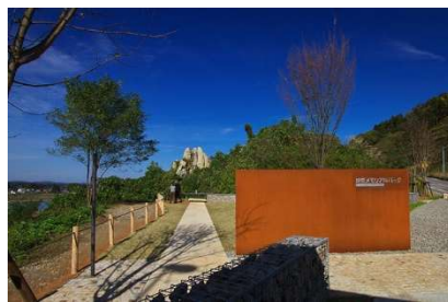
妙見メモリアルパーク