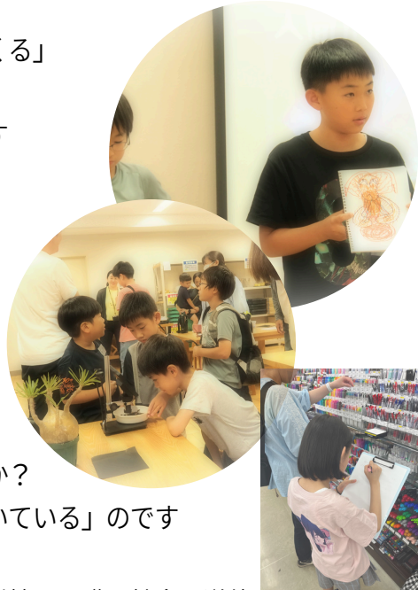
探究シリーズの様子