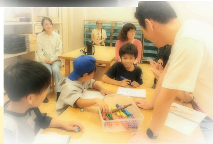
発見シリーズの様子