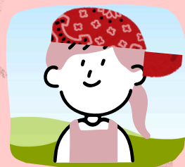
エプロン・バンダナ