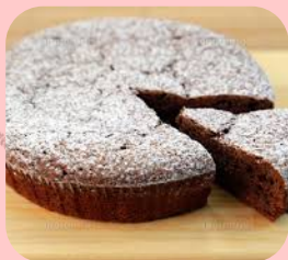
ガトーショコラ ※画像はイメージです