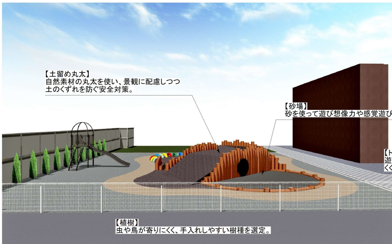
使用材料:【土留め丸太】Φ250防腐塗装丸太【植樹】H1.7m級ヨーロッパゴールド【砂場】左官砂