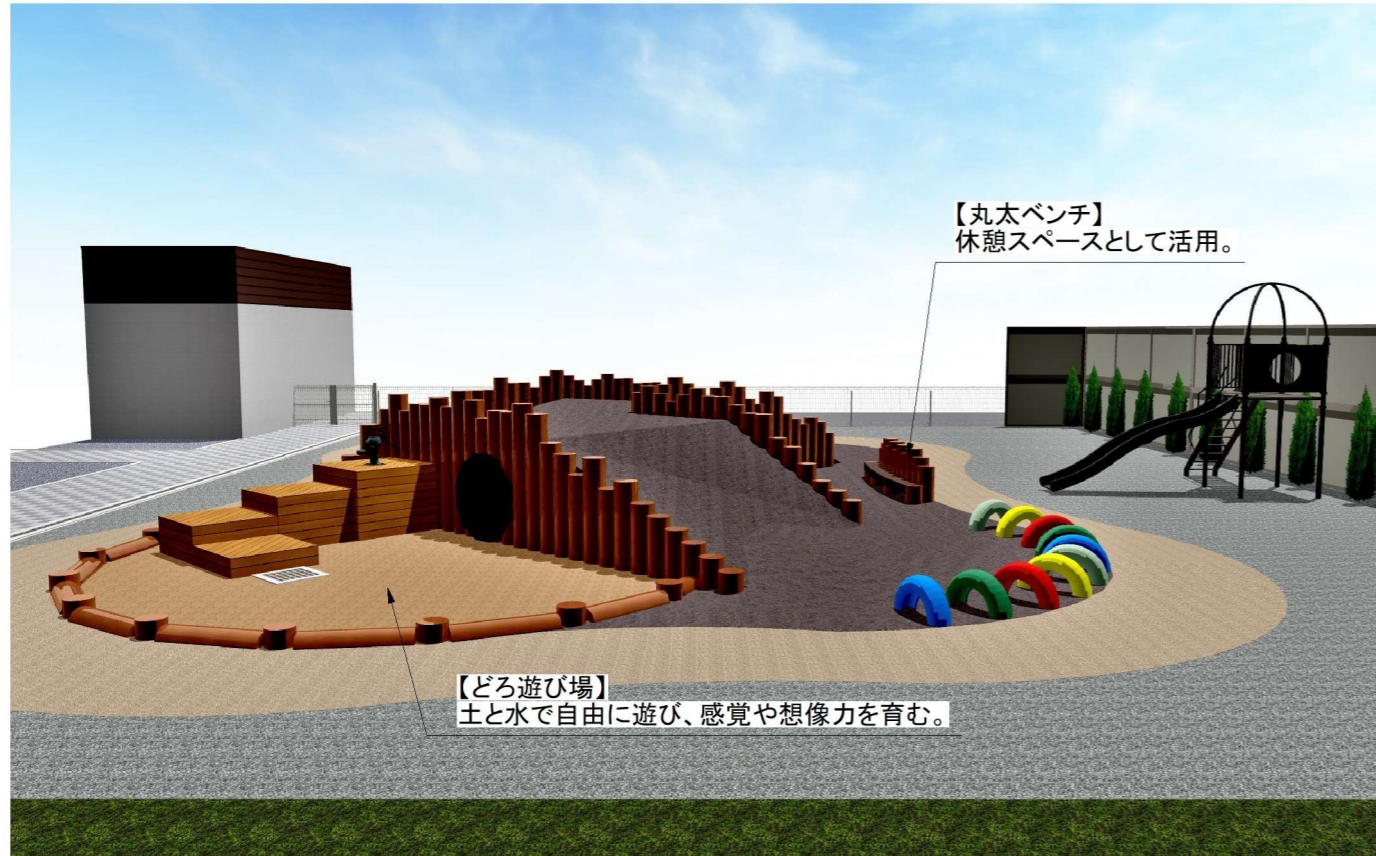
使用材料:【どろ遊び場】粘性土【丸太ベンチ】Φ250防腐塗装丸太・ベンチ板