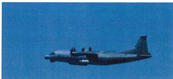
空自が撮影したY-9情報収集機

8月26日、自衛隊は、中国軍のY-9情報収集機が11時29分頃から11時31分頃にかけて長崎県男女群島沖の領海上空を侵犯したことを確認し、航空自衛隊西部航空方面隊の戦闘機を緊急発進させ、通告及び警告を実施する等の対応を実施しました。