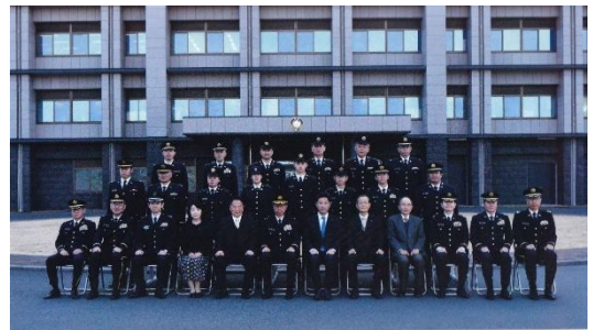
令和7年度駐屯地二十歳の集い 勝田駐屯地 令和8年1月15日