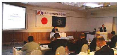
令和6年度事業計画審議