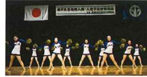
福井商業高校チアリーダー部