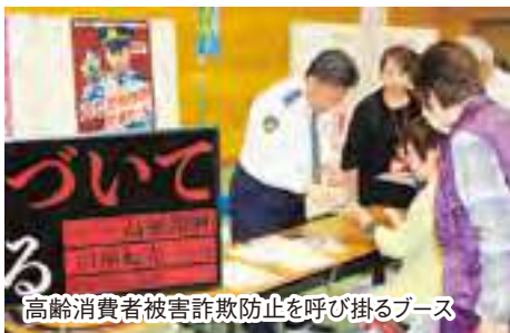
高齢消費者被害詐欺防止を呼び掛けるブース