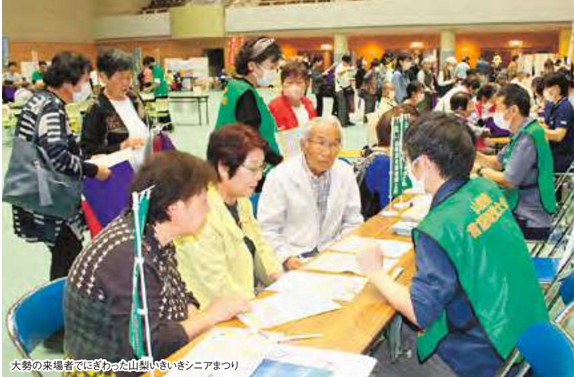
大勢の来場者でにぎわった山梨いきいきシニアまつり