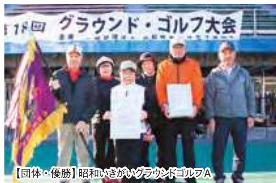
【団体・優勝】昭和いきがいグラウンドゴルフA