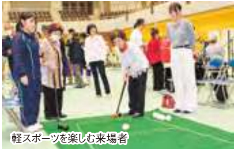
軽スポーツを楽しむ来場者