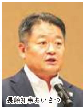
長崎知事あいさつ