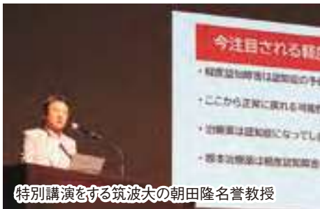
特別講演をする筑波大の朝田隆名誉教授