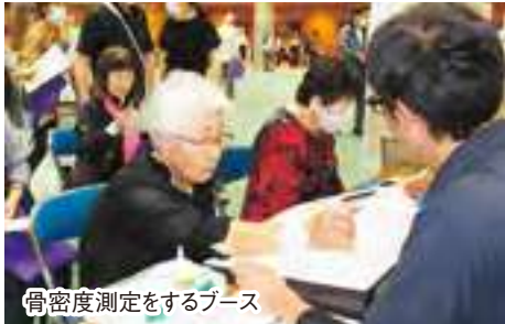
骨密度測定をするブース