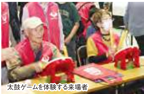
太鼓ゲームを体験する来場者