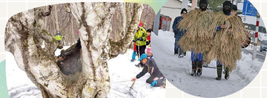
幹周りの雪が溶けたあがりこ大王