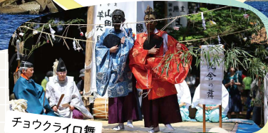
チョウクライロ舞