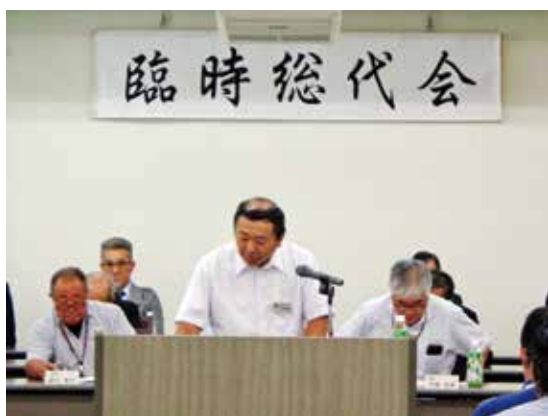
（山田議長による議事進行）