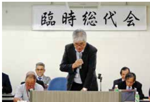
（大橋理事長ご挨拶）