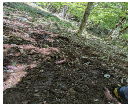
【ゴミの状況 こんな場所が、まだたくさん広がっています】