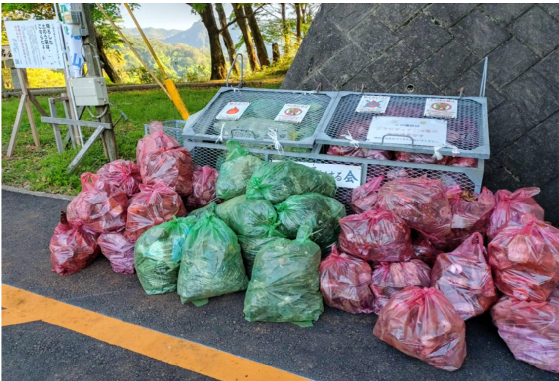
【山と積まれてたリサイクル袋 赤→缶、ビン 緑→ビニール袋、弁当ガラなど】