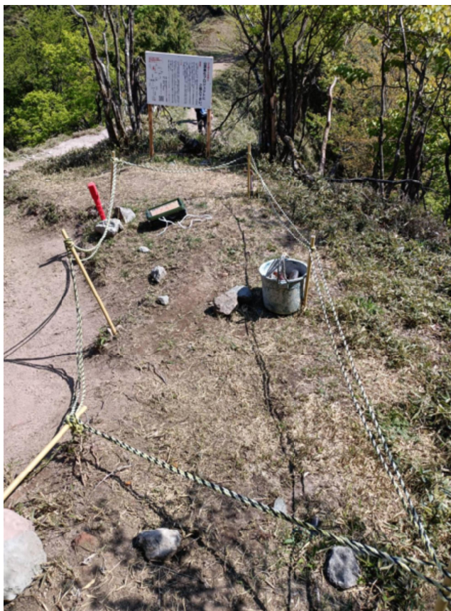
【5月10日夕方の山頂仮置き場】