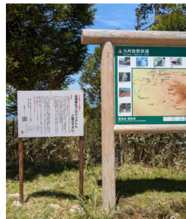
【中岳の協力依頼看板】